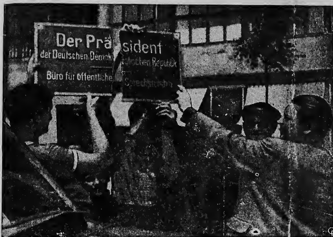
ALS TEKEN VAN PROTEST sloopten de demonstranten een naambord van een der overheidskantoren en sloegen het in stukken. Het is het naambord van het kantoor van Wilhelm Pieck, de communistische President van Oost Duitsland sinds 1949.

GROF GESCHUT heeft zijn werk gedaan. Onze voorstellencommissie in New York heeft na de vele harde woorden, ook Aruba ontdekt. Daar vonden wij het bewijs van in een velenlijk artikel over de Antillen, waarin Aruba onkele maalen met naam genoemd wordt, dat verscheen in tal van Amerikaanse bladen, waaronder de Kalamazoo Mich. Gazette. Natuurlijk blijft er nog wel iets te wensen over en vinden wij een zin a.s.: They (the Leeward Islands) consist of Curacao, the capital and most important; Aruba, famous for its oil refineries "nog altijd niet bijzonder elegant. „Most important“ is een betrekkelijk begrip. Voor de Amerikaanse toerist zou, we uiten slechts een veronderstelling, Aruba: z'er ve', „the most important“ kunnen zijn, door zijn prachtige baaien en reuzen-AMERIKAANSE-raffinaderij. De zin had ook zo kunnen luiden on had ons dan beter volaan: „The Leeward Islands are famous for their glant' oil refineries; they consist of Curacao, the Capital en Aruba wit' dit' fairy-tale landscape and ideal tropical beaches.“ In het artikel wordt in kort bestek de geschiedenis van de eilanden gegeven; er wordt iets in verband over de raffinaderijen en ook de toeristische aantrekkende (Vervolg op pag. 4)